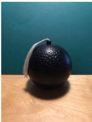
• bomba z gry Tik Tak boom firmy Piątnik

5. Nauczyciel dzieli uczniów na dwie drużyny. Uczniowie otrzymują od nauczyciela mini słowniczek obrazkowy ze sprzętem sportowym. Nauczyciel zadaje naprzemiennie grupom pytania: Czego potrzebujesz do np. pływania? Uczniowie odpowiadają pełnym zdaniem, stosując rzeczownik w bierniku. W czasie odpowiedzi jedna z osób z grupy trzyma w ręku tykającą bombę. Grupa musi szybko odpowiadać, aby się jej pozbyć. Drużyna, w której rękach wybuchnie bomba, traci punkt na rzecz przeciwników.